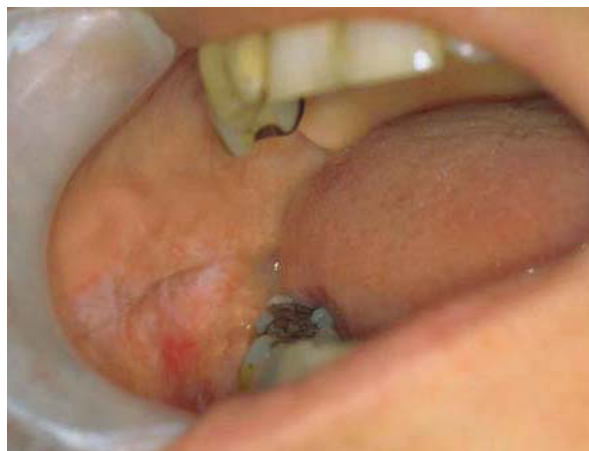
Lichenoid kontaktreaksjon mot amalgam hos en pasient med allergi mot kvikksølv.

Lokale bivirkningsreaksjoner kan oppstå på harde tannvev, i pulpa, i tennenes støttevev samt i munnslimhinnen (4). De hyppigste lokale reaksjoner er lichenoid kontaktreaksjoner i munnslimhinnen i relasjon til tannfyllingsmaterialer og andre odontologiske biomaterialer (5;6) (se faktarute Oral lichen planus og lichenoid kontaktreaksjoner på s. 11). Vanligvis er det allergiske reaksjoner mot stoffer lekket ut fra tannrestaureringsmaterialer, f.eks. kvikksølv og gull.